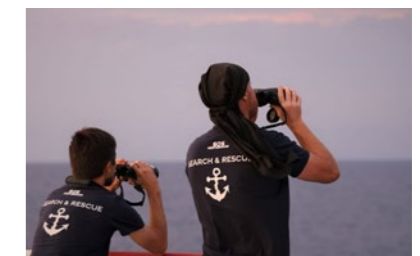
P. 28 - Équipe de recherche et de sauvetage en mer