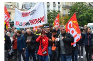
P. 38 - Septembre 2019 : Manifestation à Paris contre la réforme des retraites