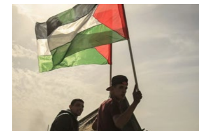
P. 24 - Préparation March of return (28 March 2018)