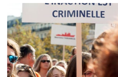
P. 32 - Manifestation de soutien à l'Aquarius