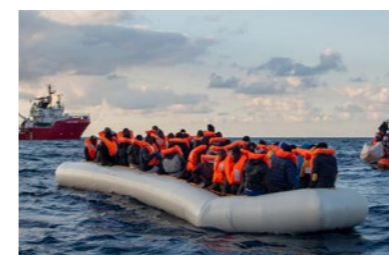
P. 31 - © Anthony Jean / SOS Méditerranée