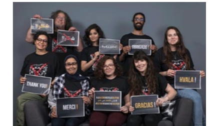
P. 16 - Remerciement de l'équipe de Racines pour le soutien de l'association lors du procès ayant abouti à sa dissolution