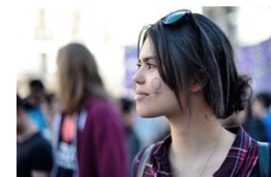
P. 42 - 8 mars 2015 : des milliers de femmes revendiquent leurs droits dans les rues de Madrid