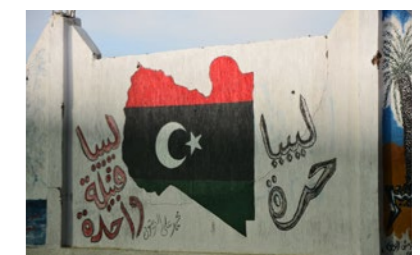
P. 34 - Graffiti du drapeau lybien