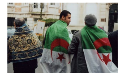
P. 50 - Février 2011 : Manifestation algérienne à Bruxelles