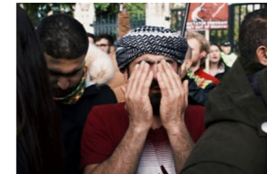
P. 12 - Octobre 2019: des manifestants kurdes défilent à Londres contre l'invasion de la Syrie par l'État turc.