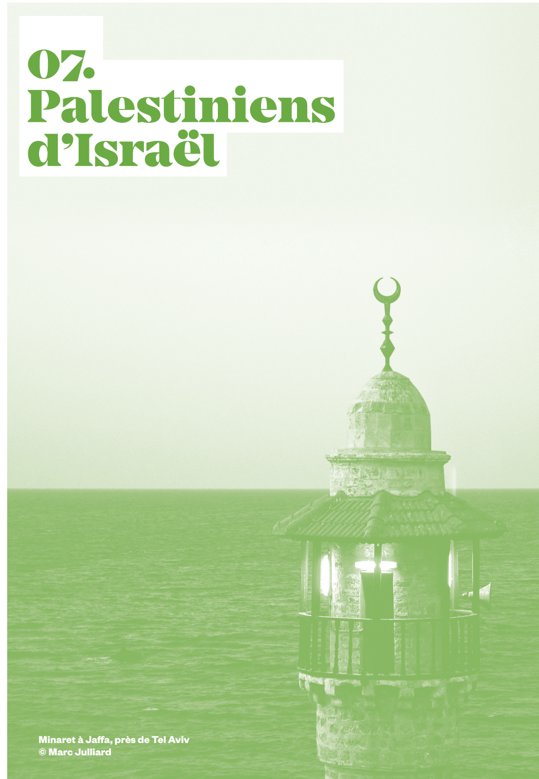
Minaret à Jaffa, près de Tel Aviv